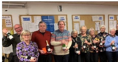
Rækkevinderne fra ChampagneTurnering 2022