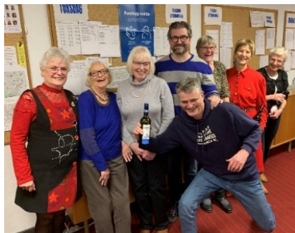
Rækkevinderne fra juleafslutning 2022