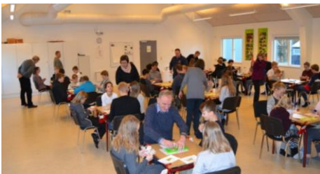
Det syder af bridge og koncentration på Friskolen