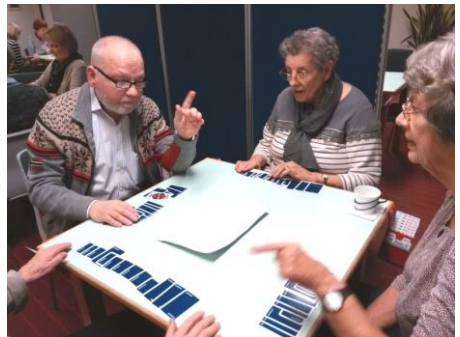
Hov hov, man er vel ikke lektor og bridge-lærer for ingen ting!