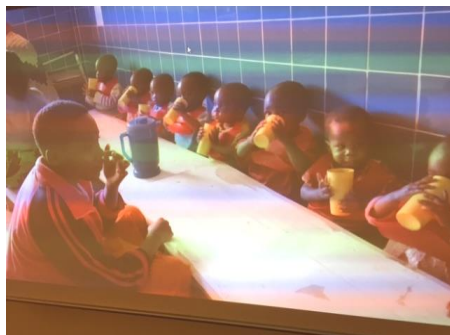
Børnehavebørn fra Tanzania