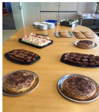
Flere medlemmer havde bakt lækre kager

I år deltog der 25 par. 8 fra Heikendorf og 17 fra AaBC. Det var 12. gang venskabsturneringen blev gennemført.